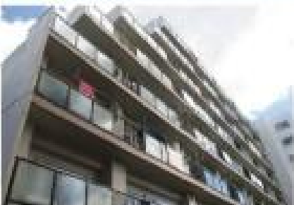
外観 平成29年12月撮影