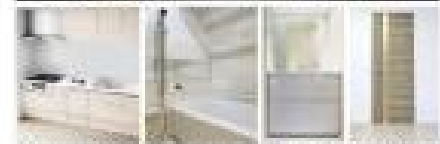
住居用フローリング・ウォール・天井・床 / 廊下・玄関・バルコニー

Natural style 平成29年12月17日完了予定 新規内装リノベーション中 美しいフローリングと天井・壁紙を自らも手掛けた、高級感あふれる仕上がりを実現。こだわりの内装を堪能してください。