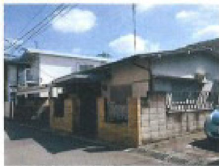
※対象不動産現地併存時 このハウジングマップは標準納付図です。実際と状況が異なる場合は現況優先となります。